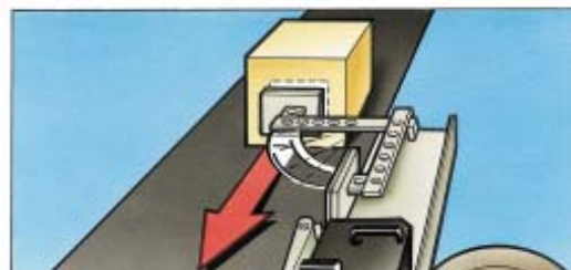
Kisten- und Paketauszeichnung. Anwendung für in Bewegung befindliche Produkte!