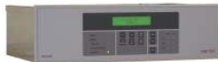
Drucker-Steuereinheit PCU III