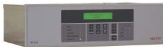
Drucker-Steuereinheit PCU III